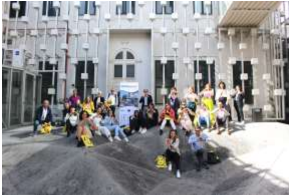
Rencontre transnationale à Braga, Portugal, Juin 2024

Dynamisation des centres-villes & Evaluation